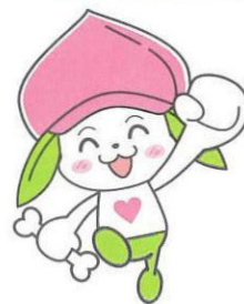
協会けんぽ福島支部マスコットキャラクター ケンタくん